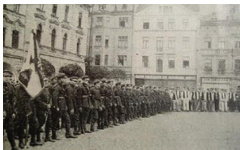
Ochotnicy w Białej

24 września kolejni Wilkowianie wyruszają z Białej w ramach tzw. II Powołania i zasilają 2 Pułk Piechoty II Brygady Legionów.