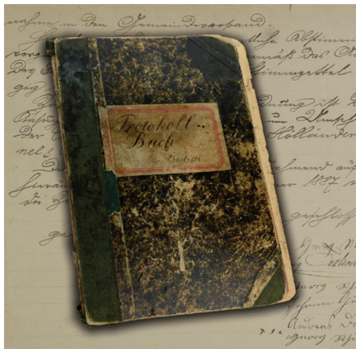
Protokoły Rady Gminy Bystra 1886–1918

Gmina Bistrai, w myśl ustawy gminnej dla Księstwa Śląska z 1863 r., była tzw. gminą miejscową, mającą swój osobny