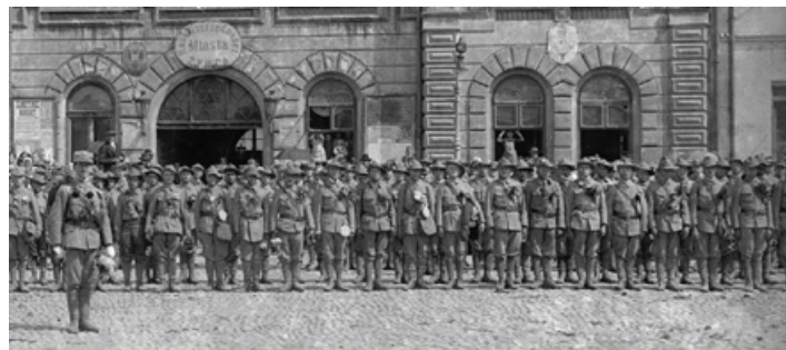
Wymarsz ochotników z Żywca

Również 26 sierpnia 1914 r. kompletnie umundurowani i wyekwipowani stanęli wśród innych na placu Wolności w Białej ochotnicy z Wilkowic. Było to tzw. I-sze Powołanie. Oddział ten wraz z sokołami z Wadowic i Żywca utworzył 12 kompanię III batalionu 3 Pułku Piechoty II Brygady.