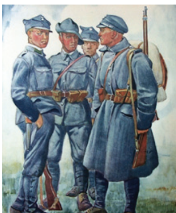
Album Legionów Polskich. [Warszawa, ok. 1936]

Lipiec 1914 roku – wybuch I wojny światowej. W tym czasie działa już od końca XIX w. szereg polskich organizacji narodowych, w tym Towarzystwo Gimnastyczne „Sokół” i Towarzystwo Sportowe „Strzelec”.