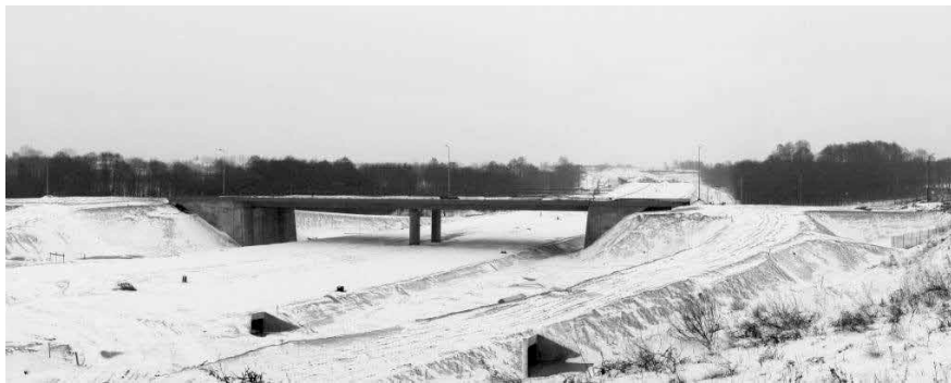
Postęp prac. Droga S69, okolice Wilkowieckiej Strefy Przemysłowej w marcu br.

Samorząd Gminy Wilkowice jest obecnie w trakcie rozstrzygnięcia procedur przetargowych i finalizacji przygotowań do inwestycji drogowej na jej terenie. Główne nakłady skierowane będą w tym roku na kontynuację remontu ul. Klimczoka w Bystrej (III ETAP), którego wykonawcą będzie firma Eurovia. Zgodnie z umową roboty będą trwały do 31 października 2013 r. Trwają również prace przygotowawcze do realizacji remontu ul. Stromej