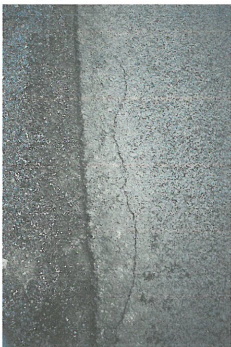
Fotografia 9 Okolice nr 82