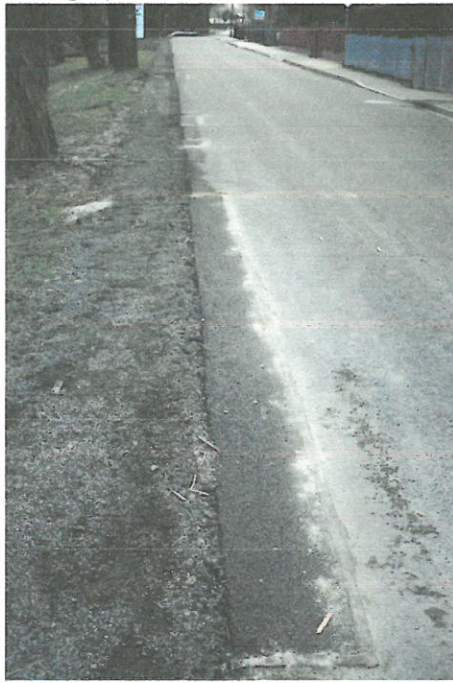
Fotografia 10 Pierwsze naprawy