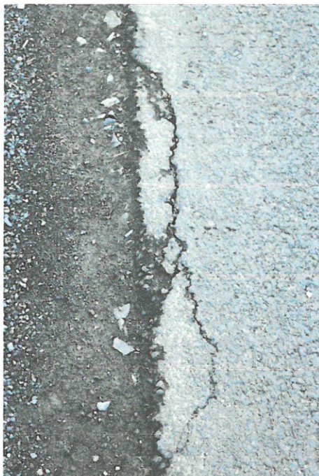
Fotografia 7: Okolice nr 78