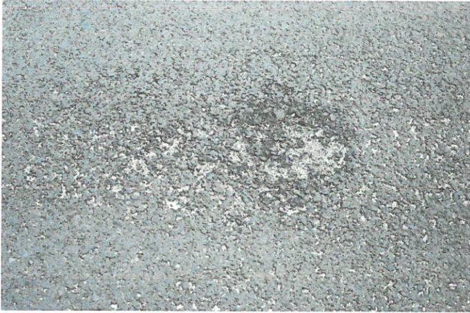
Fotografia 1 Ubytki w asfalcie okolicy szpitala