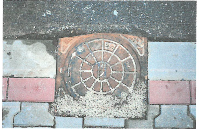
Fotografia 4: Studzienka