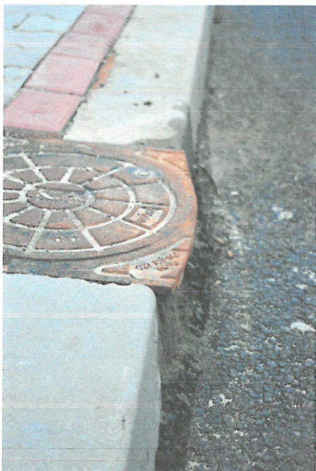
Fotografia 5: Studzienka