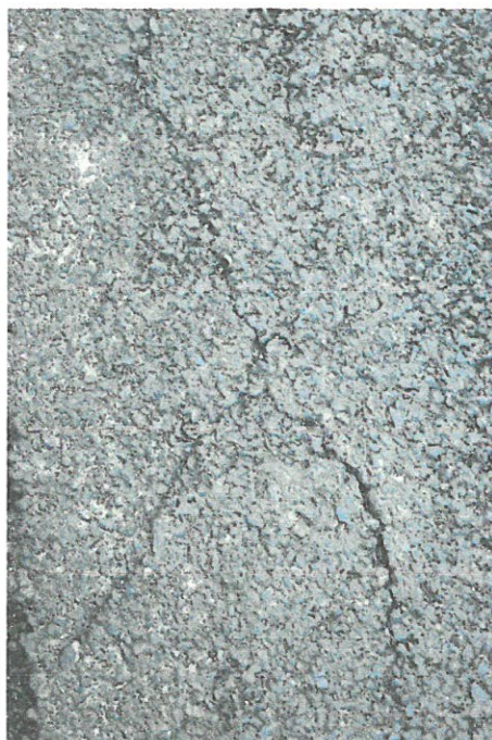
Fotografia 8 Okolice nr 78