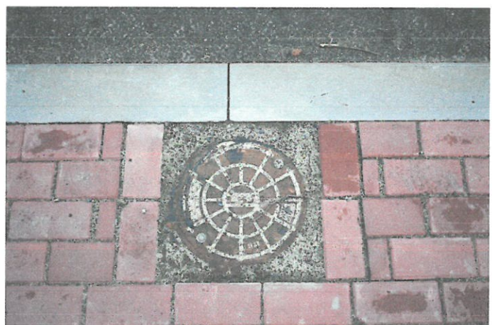
Fotografia 6: Pozostałe studzienki osadzono prawidłowo