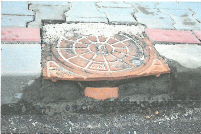
Fotografia 3: Studzienka okolicy ul. Fałata 26