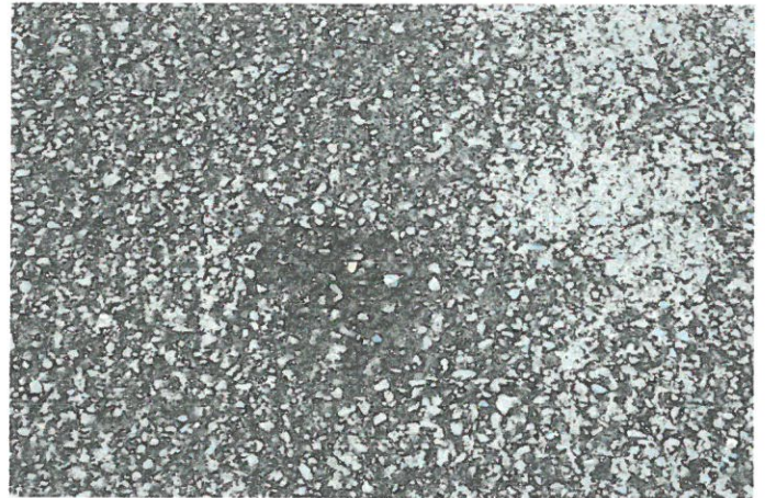
Fotografia 2: Ubytki w asfalcie okolicy ul. Fałata 20