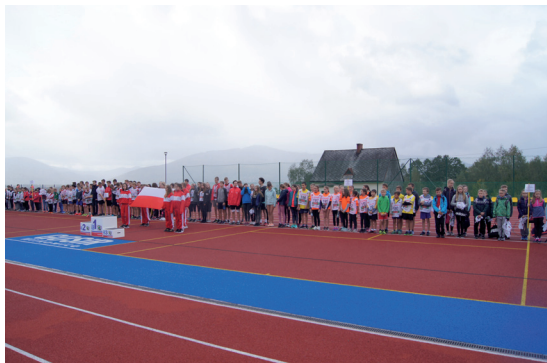
Reprezentacje lekkoatletycznych szkół z terenu Gminy Wilkowice